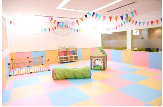
※キッズスペースとガラス越しに隣あう執務スペース（ママスクエア）