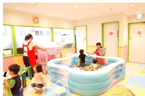
「ママスクエア」イメージ